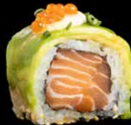
TRØFFEL MAKI kr. 205,- Laks, avocado, trøffel dressing, lakserogn, agurk, røkt unagi. Allergener: F, SE, E, M, S