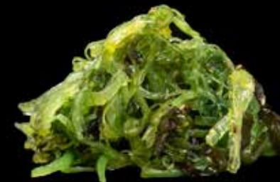
WAKAME SJØGRØNNSAK SALAT