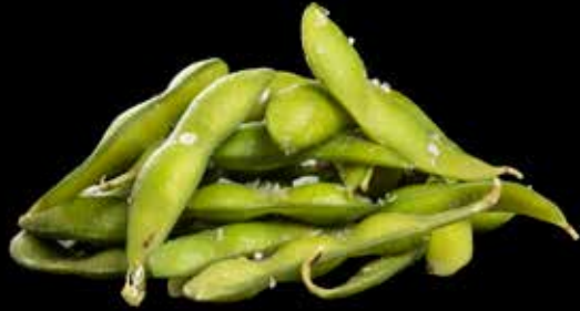
EDAMAME BØNNER MED HAVSALT