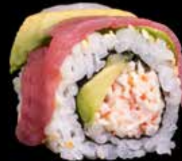
RAINBOW MAKI kr. 210,- Laks, tuna, scampi, kveite, avocado, kamskjell, crabstick, lakserogn, agurk, masago.