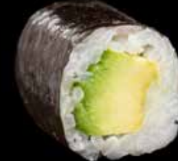
HOSO MAKI / 6 biter Hoso maki med avocado