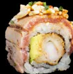
FLAMBERT TUNA kr. 205,- Tuna, tempura scampi, avocado, kimchinøtter, røkt unagi.