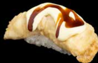
NIGIRI WASABI KVEITE