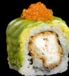
TERIYAKI KVEITE kr. 190,- Tempura kveite, avocado, lakserogn, unagi saus.