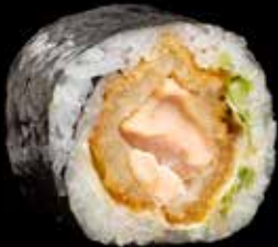
CRISPY LAKS kr. 180,- Tempura laks, ingefær, chilimayones, vårløk Allergener: G, F, S, SE, E