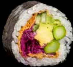
VEGETAR MAKI / 8 biter Lages av sesongens grønnsaker