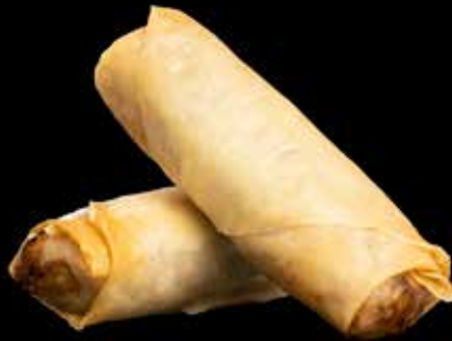
2 stk. VÅRRULL MED KYLING ELLER GRØNNSAKER