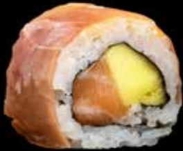
SERRANO MAKI kr. 195,- Laks, mango, chilimayones, serrano skinke Allergener: F, SE, E