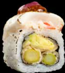
FLAMBERT KVEITE MAKI kr. 205,- Kveite, agurk, crabstick, avocado, masago.