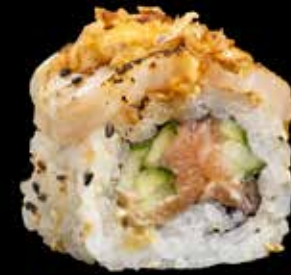
TSUBAKI MAKI kr. 205,- Laks, agurk, kamskjell, sprøstekt løk, miso dressing.