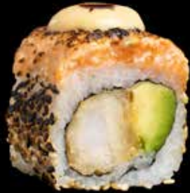
TARTAR MAKI kr. 195,- Laksetartar, tempura scampi, masago, avocado, miso dressing, chillimayones.