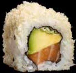
LAKS OG CRUNCHY kr. 170,- Laks, avocado, chilimayones, crunchy.