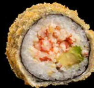
TEMPURA CALIFORNIA Crabstick, avocado, masago kr. 160,-