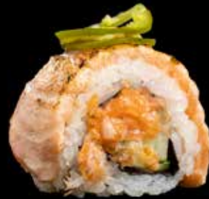
FLAMBERT JALAPENO MAKI kr. 205,- Laks, avocado, agurk, syltet jalapeno, jalapeno emulsjon.