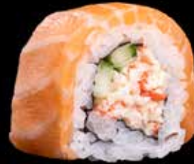
FUDZIYAMA MAKI kr. 190,- Laks, crabsticks, masago, agurk, chilimayones. Allergener: F, SK, SE, E, G