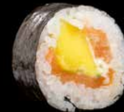
MANGO MAKI kr. 185,-Laks, mango, vårløk, chilimayones Allergener: F, SE, E