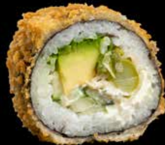
TEMPURA VEGETAR Agurk, avocado, kremost kr. 150,-