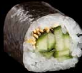
HOSO MAKI / 6 biter Hoso maki med agurk kr.