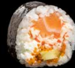
SPESIAL FUTOMAKI kr. 195,- Laks, crabstick, kremost, avocado Allergener: F, SK, S, SE, E, M, G