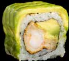
AVOCADO MAKI kr. 185,- Tempura scampi, avocado.