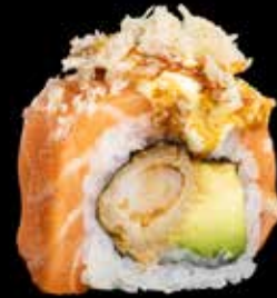
SAKURA MAKI kr. 205,-Laks, tempura scampi, avocado, wasabi saus, crunchy.