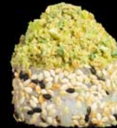
GREEN RIVER MAKI kr. 185,- Laks, chillimayones, agurk, wasabipeanøtter og wasabierter.