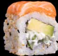
PHILADELPHIA MAKI kr. 185,- Laks, avocado, agurk, kremost Allergener: F, SE, M