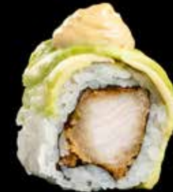
GREEN CHICKEN MAKI kr. 195,- Kylling, avocado, nøttdressing.