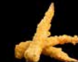
TEMPURA SCAMPI 4 BITER