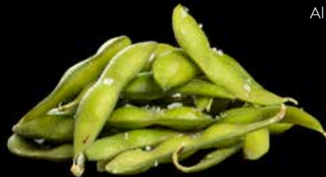
EDAMAME BØNNER MED HAVSALT