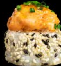
BAKT MAKI kr. 190,-Laksetartar, crabstick, chilimayones, masago, avocado.