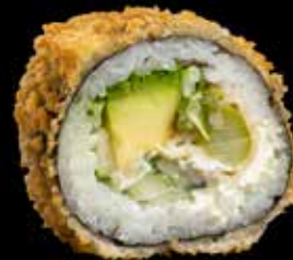
TEMPURA VEGETAR / 8 biter Asparges, agurk, avocado, kremost kr.