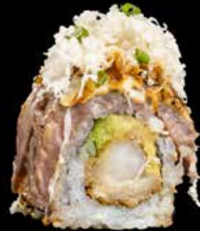
BIFF MAKI kr. 240,- Biff, tempura scampi, avocado, fersk pepperot, sprøstekt løk, wasabi saus.