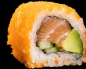
ALASKA MAKI kr. 190,- Laks, avocado, masago, agurk Allergener: F, SE