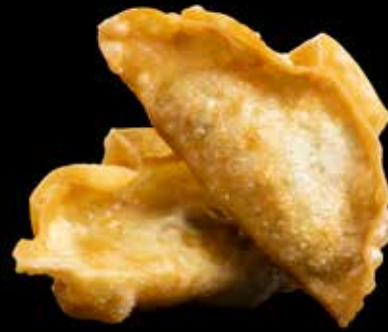
GYOZA MED KYLLING 6 stk.